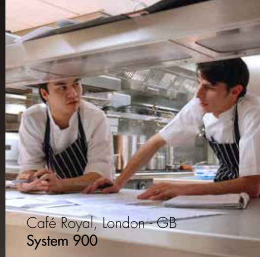
Café Royal, London - GB System 900