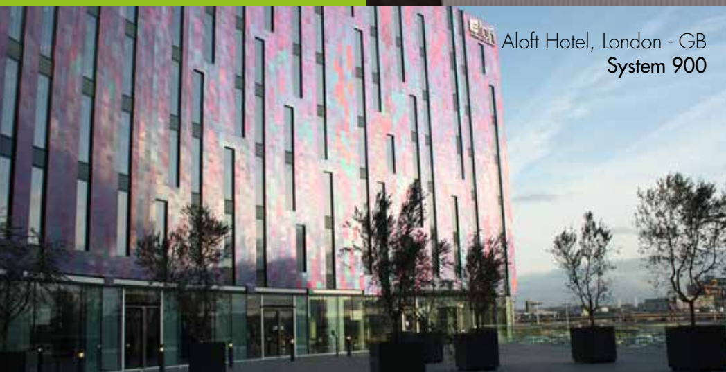
Aloft Hotel, London - GB System 900

■ Reduzierter Zeit- und Kostenaufwand bei Betrieb und Wartung