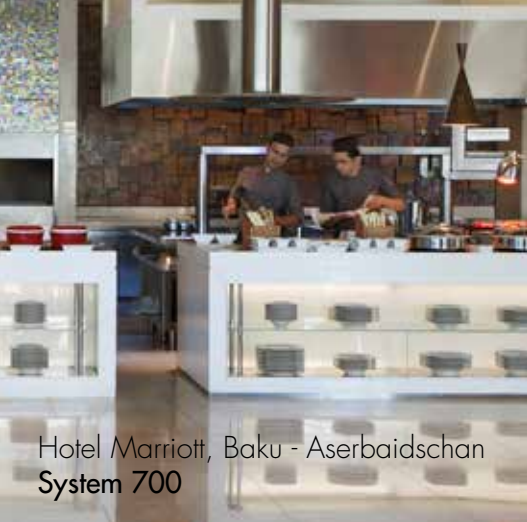
Hotel Marriott, Baku - Aserbaidshan System 700