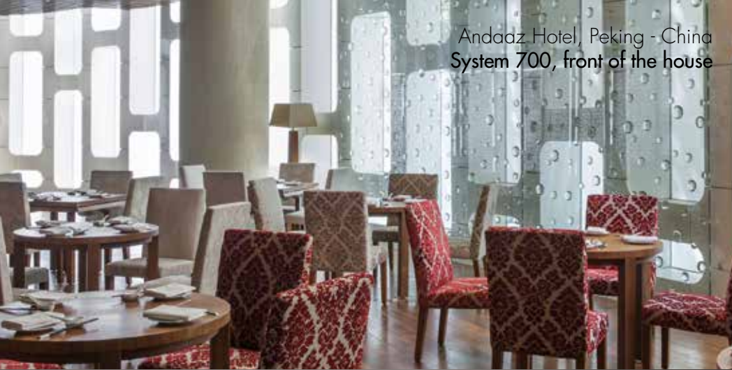
Andaaz Hotel, Peking - China System 700, front of the house